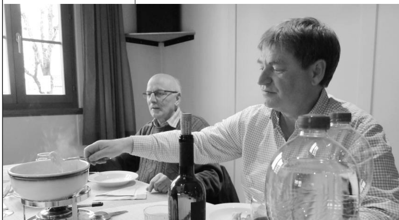
Fondueplausch HV 2025

Inhalt: HV, 21. März 2025 3 Ein Männerchor jubiliert 7 Jubilieren in sechs Sprachen 11 Keep our swissness great 13