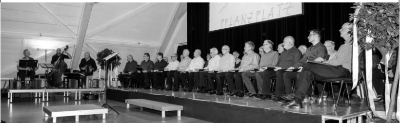
Erinnerung an unser letztes Konzert